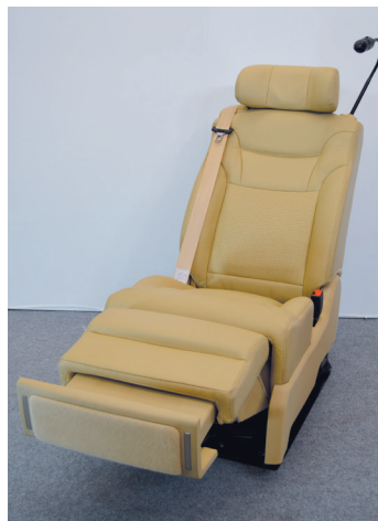
体を包み込むホールドを生み出すサイドサポートをご堪能頂けるA380。