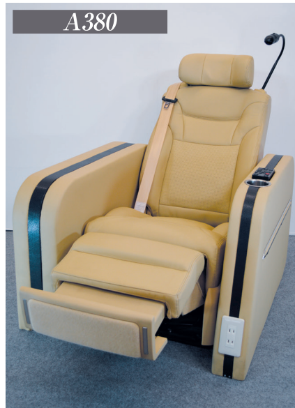
A380は、フットレスト&レッグレスト一体型シートで、長時間の移動でも御乗車頂いたお客様に究極の空間をご提供させて頂いております。 ※上記のアームレスト装着はイメージです。シートに含んでおりません。