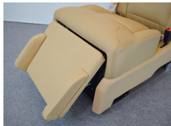
A380-Fの場合レッグレストのみの設定で、傾斜角度50°で設定。レッグレストに足を置いても足をホールドするサイドサポートを装備。