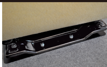
A380のシートアタッチメント(リア)は、床から2本のボルト固定方式。