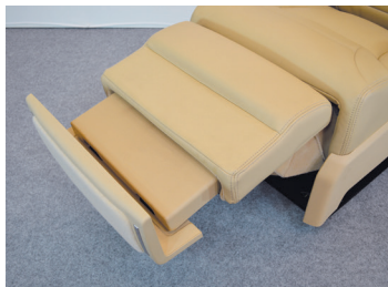
A380のフットレスト&レッグレスト一体型で、上下前後2段階のレッグレストは上昇角度80°で設定。さらにフットレスト(手動)まで装着しております。