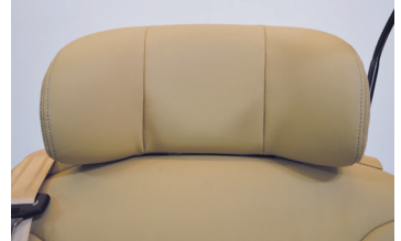
A380シリーズのヘッドレストは、車両走行時の横揺れでも頭部をホールド出来る形状にしております。