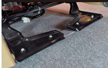
A380シリーズのシートアタッチメント(フロント)は、接地面が大きく4本ボルトでシート固定に優れています。

※A380シリーズは、シート装備の充実だけでなく、安全・安心を最優先に考えシートアタッチメントの強化をしております。