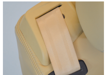
お客様の安全を第一に考えた3点式シートベルトの本体は、シートバック内蔵型です。

※A380シリーズは、シート装備の充実だけでなく、安全・安心を最優先に考えシートアタッチメントの強化をしております。