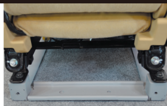
A380-Fは、シートアタッチメント取付部を高さ60mmアップし、前席のシート下にゆとりの爪先収納スペースを確保。