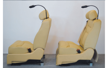
A380では、シートピッチを最小でも1,200mm以上を必要としていましたが、A380-Fであればシートピッチが、最小で1,000mmでのシート設置が可能となります。