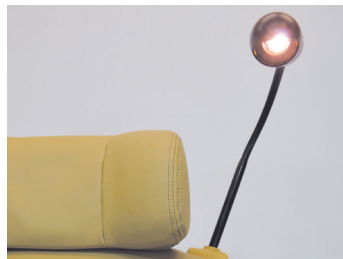
移動時間を快適に過ごせ自在な角度調整が可能なLED照明を装備した読書灯。