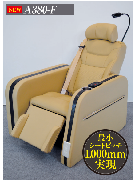
A380-Fは、より多くのお客様に、ご乗車いただける様にシートピッチ幅を小さく設定するために、レッグレストの傾斜角度を50°と大幅に見直しました。 ※上記のアームレスト装着はイメージです。シートに含んでおりません。